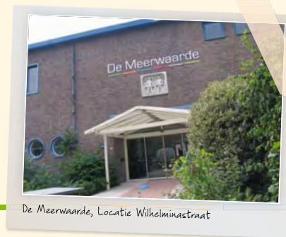
De Meerwaarde, Locatie Wilhelminastraat