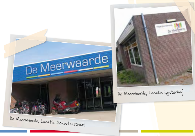
De Meerwaarde, Locatie Schoutenstraat